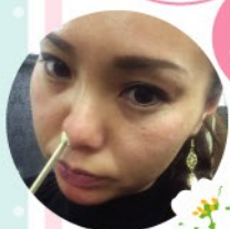
グレーススタッフ イノリ