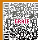
グレースのブログ★