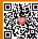
スマートフォンの方はコチラ!